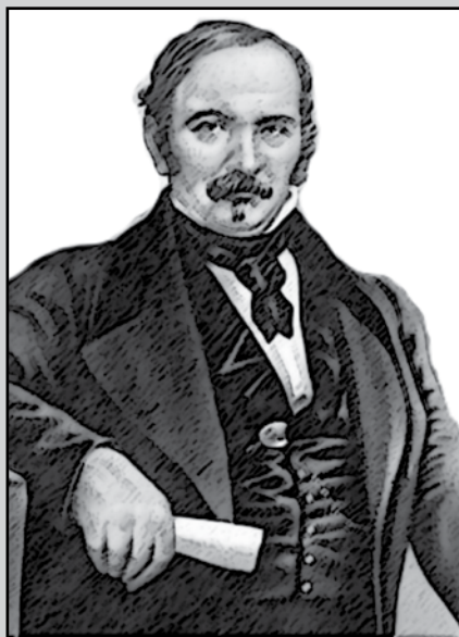
Allan Kardec (Lyon, 3 de outubro de 1804 - Paris, 31 de março de 1869)